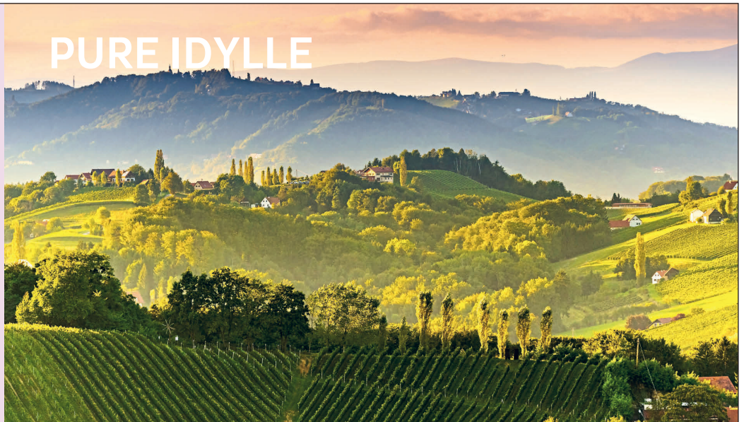
Blick auf die Steirischen Weinstrassen

klimaneutral dank 100 % CO 2 -Kompensation