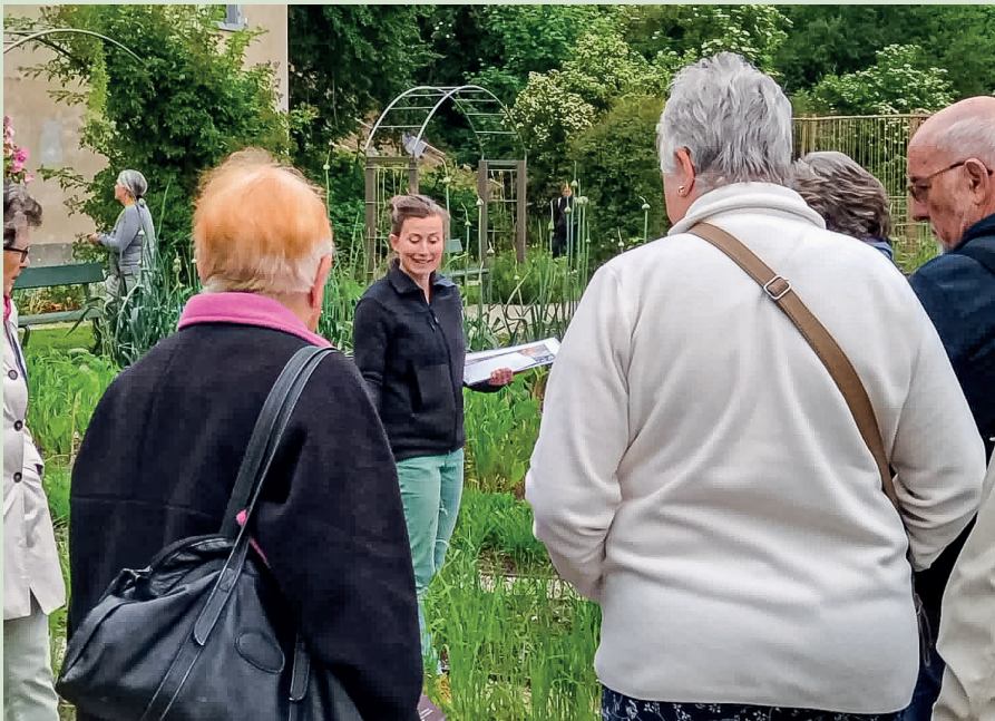
Spannende Einsichten in den Merian-Gärten

Krumme Rüebli, blaue Tomaten, blühender Schnittlauch etc. Im Reich von Pro Specie Rara unterhalb der Villa Merian, das wir mit SVNW-Mitgliedern anlässlich einer Führung besuchten, gedeihen die eigentümlichsten Pflanzen. Die