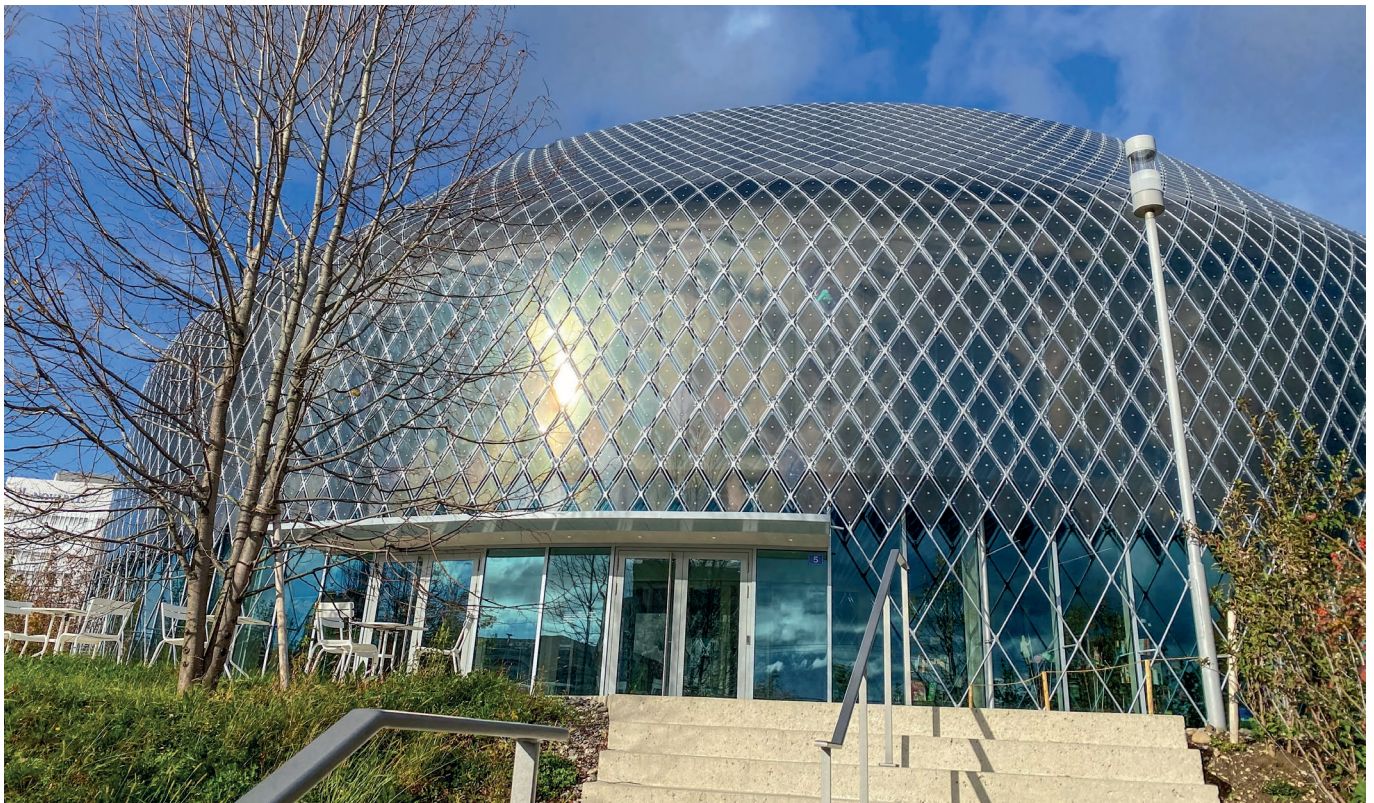
Spannende Referate hier im Novartis Pavillon.

Am 19. April kamen über 100 Personen in den Novartis Pavillon, um an der Veranstaltung «Das Alter gut informiert und praxisbezogen planen» teilzunehmen.