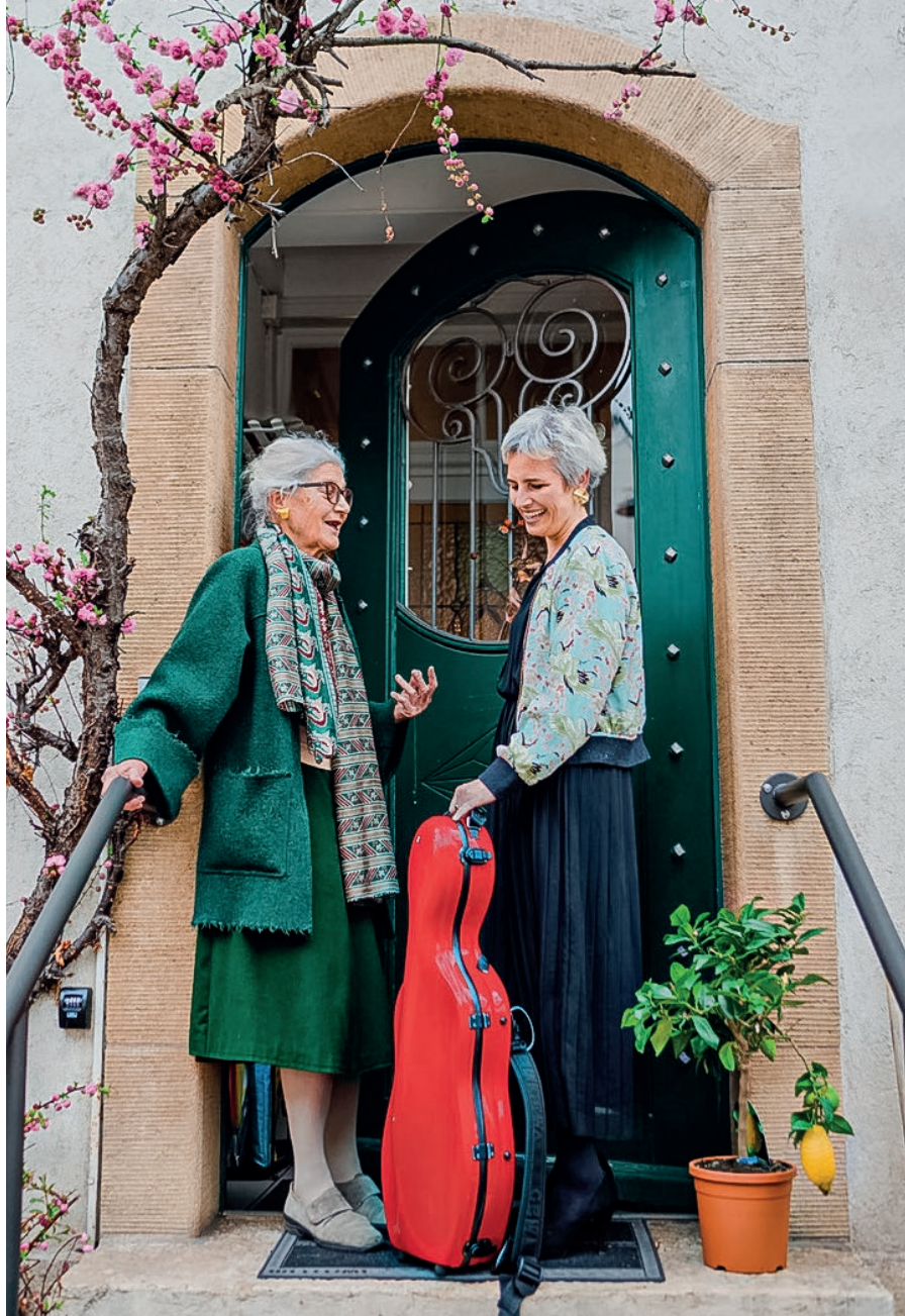
Im Jahr 2022 besuchten Musiker:innen vom Verein Cassiopeia insgesamt 140 Mal Seniorinnen und Senioren zu Hause, um private Konzerte zu spielen.